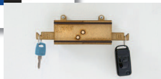
3. Sleutelhouder Keymoment helpt je op een ingenieuze manier om meer te bewegen.